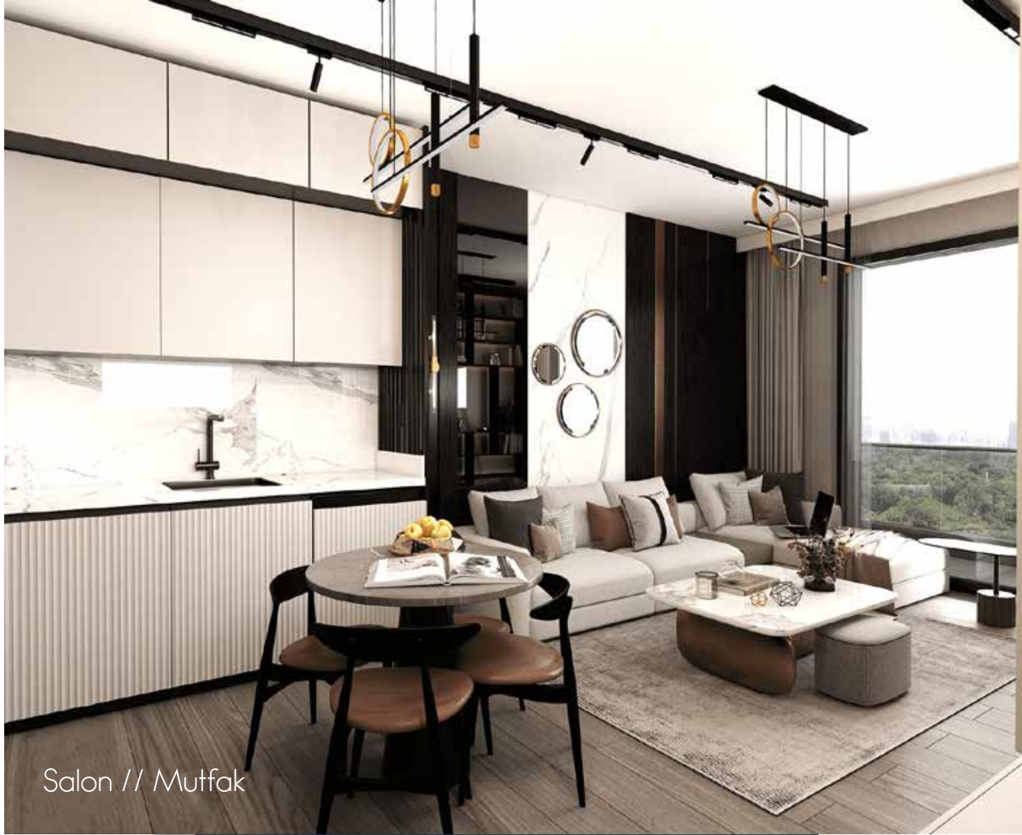
Salon // Mutfak